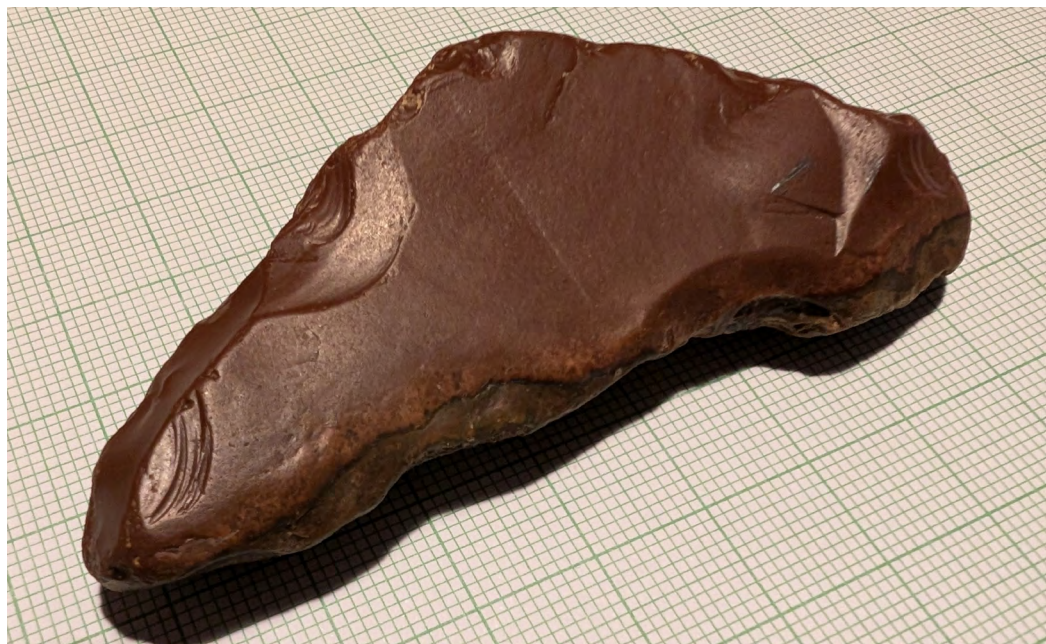
Jaspisový kámen nalezený v ploše mezi archeologickými objekty, který interpretujeme jako středně paleolitické škrabadlo. Fotografie byla pořízená na milimetrovém papíře pro představu o velikosti artefaktu.

Během právě dokončené fáze výzkumu došlo k objevu dalších 40 zahloubených objektů, které se však vymykají všemu, co jsme doposud mohli v Českém ráji spatřit. Při skrývkách sprašového nadloží na úroveň fluviaální šterkopískové terasy se poda-