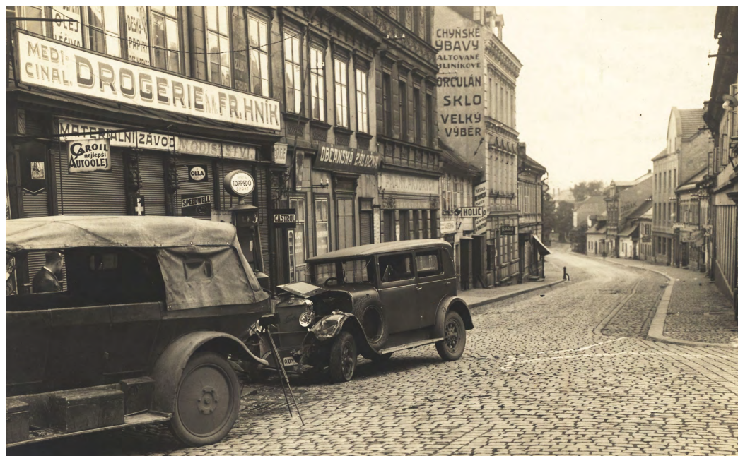
V listopadu 1924 se do jednání městské rady dostala poprvé žádost o zřízení čerpací stanice ve městě. Fotografie, která byla pořízena kvůli srážce dvou automobilů, nám dává vědět, kde přesně stojan na benzin stál.