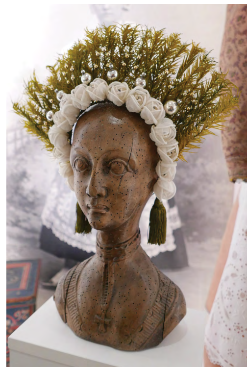
Dřevěná vyřezávaná hlava, tzv. palice, se svatební čelenkou, polovina 19. století, severovýchodní Čechy

Vystavené exponáty jsou výběrem z bohatého fondu etnologické sbírky muzea. Jedná se o předměty dokumentující kulturu všedního dne od konce 18. století do období po první světové válce. Některé z vystavených exponátů byly sebrány a následně prezentovány na Národopisné výstavě československé, která se konala v roce 1895 v Praze. První část expozice je věnována lidovému stavitelství. Návštěvníka zde osloví nejen kresby Jana Prouška a Josefa Václava Scheybala, dobové fotografie Jana Šimona a Petra Matouška, ale i unikátní modely lidových staveb Josefa Licehamera. Další část expozice je věnována ukázkám lidovému nábytku. Ze sbírky lidového textilu byly do expozice vybrány ukázky ženského svátečního a obřadního kroje, které doplňují vyšíváné čepce, vínky, šátky a další oděvní doplňky. Nechybí zde ani ukázka lidového kroje dětí a obřadního oděvu kojenců nebo mužský sváteční lidový kroj. Třetí část expozice je věnována výjimečným výtvarům místních řemeslníků. Dílo řezbářů prezentují vyřezávané dřevěné formy na modrotisk, válečky a formy na máslo a formy na perník. Dovednost hrnčičův dokládají nejen vystavené nádoby na vaření a pečení pokrmů místní produkce, ale i reprezentativní mísy a džbány, které se do našeho regionu dovážely z nedaleké Žitavy nebo slezského Boleslavce. Vrchol řemeslné dovednosti pak dokládají práce místních kovářů a cizelérů: kované pokladnice, dveřní a nábytkové zámky či panty a vývěsní štíty.