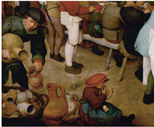
Přelévání piva. Výřez obrazu Venkovská svatba, Pieter Bruegel, 1568.

Chmel se nejprve zřejmě sbíral divoký, ale již z poslední čtvrtiny 11. století máme u nás první doklady o chmelnicích, tedy polním pěstování chmelu. O pěstování chmelu ve středověku máme doklady i z našeho regionu, a to ze Zlomků urbáře kláš-