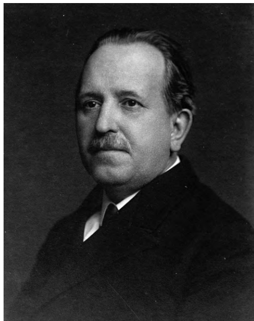
Josef Vítězslav Šimák

Průvodce je dodnes cenným historickým pramenem pro bádání v oblasti dějin turistiky. Zajímavá je zvláště kapitola „cestovní pokyny“. Šimák v ní doporučoval turistům, kteří chtěli poznat Turnovsko důkladněji, aby zde setrvali alespoň týden. Při omezení se na hlavní turistické cíle a při použití vlaků nebo povozů měly stačit tři dny. Turistům příjíždějícím z větší dálky doporučoval přijet