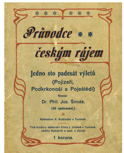
Přebal turistického průvodce