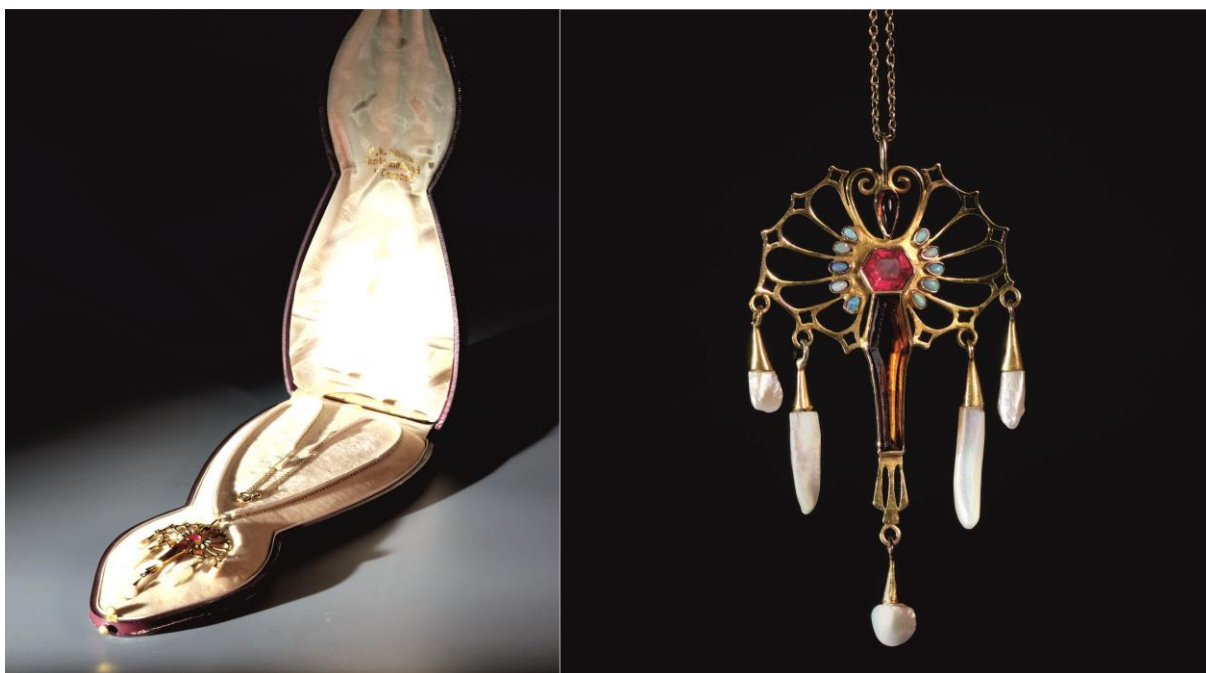
Secesní zívěs s drahými kameny, zhotovený v turnovské šperkařské škole mezi lety 1909-14.

Tato koncepce ideově vychází ze strategického dokumentu „Koncepce rozvoje kulturních příspěvkových organizací Libereckého kraje na léta 2021–2027“ byla schválena usnesením Rady Libereckého kraje č. 1592/20/RK ze dne 8. 9. 2020 a následně Zastupitelstvem Libereckého kraje usnesením č. 334/20/ZK ze dne 22. 9. 2020.