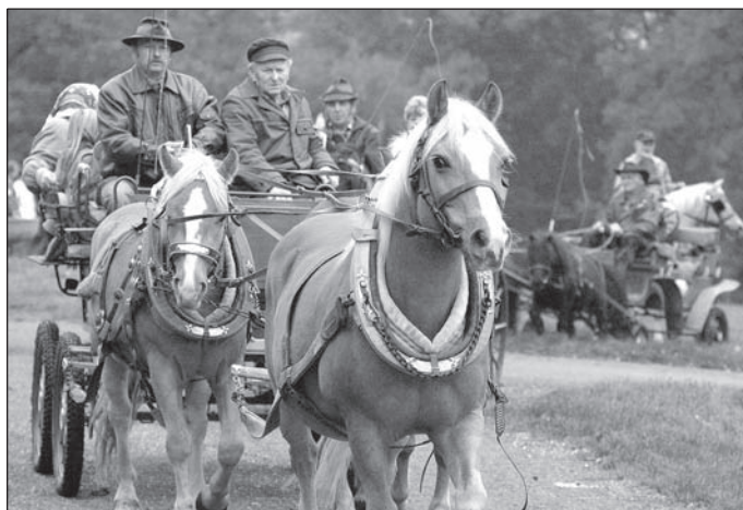
Na archívním snímku je Selská jízda v prostoru kempu v Sedmihorkách.