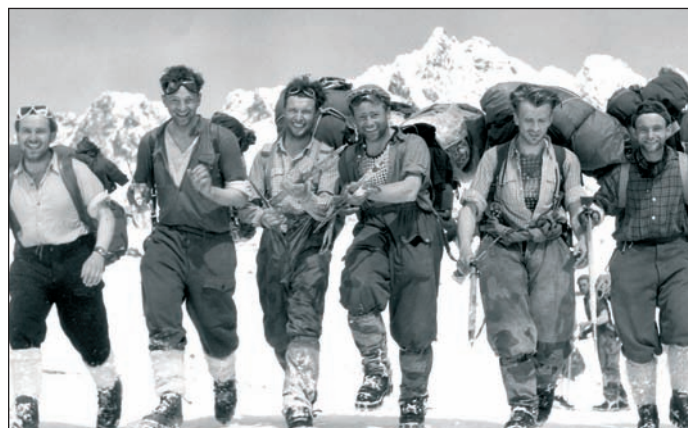
Horolezecká reprezentace v 50. letech 20. století.

* Jistíš mě? Horolezectví v Českém ráji. Výstava, kterou jsme otevřeli 17. května, zaznamenává velmi dobré ohlasy. Hned její vernisáž nám strhla vernisážové rekordy, protože jsme zaznamenali přes 250 návštěvníků. Naštěstí jsme tuto výstavu otevírali zároveň s výstavou Vilém Heckel neznámý, a tak se mohli hosté po slavnostním programu rozmistit do dvou velkých