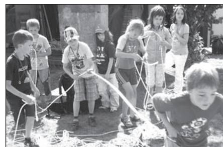
Ilustrační foto ze zauzlované dílny.