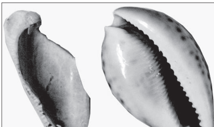
Vlevo nález, vpravo dnešní lastura.