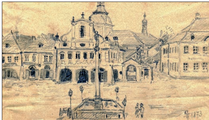
Jedno z prvních vyobrazení kašny se sochou Panny Marie na turnovském náměstí z 12. září 1873.