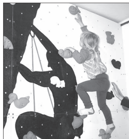
V rámci muzejní noci děti zdolávaly lezeckou stěnu.