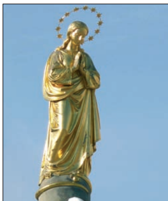
Socha P. Marie na kašně na turnovském náměstí.