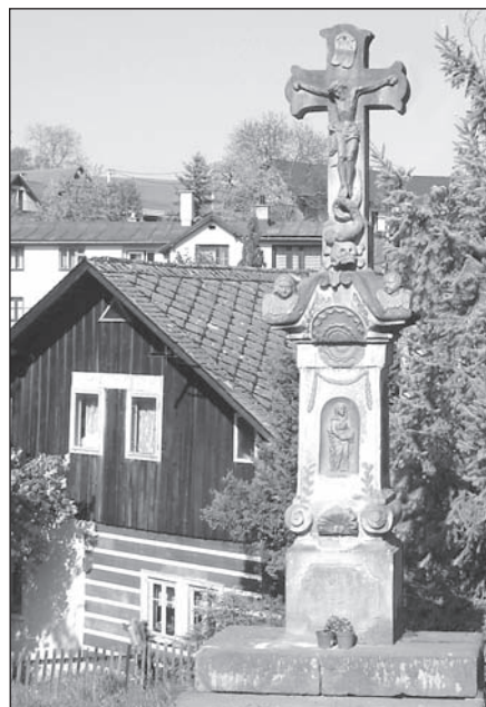
Na snímku je křížek z Holenic u Libuně.

Po staletí patří sochy neodmyslitelně k české krajině. U místních jmen se setkáváme s výrazy U křížku, U Jána, U svatého Josefa atd. Jejich přítomnost nebo spíše nepřítomnost si uvědomíme, až když jsou zničeny nebo, jak je to v posledních desetiletích bohužel běžné, odcizeny. Boží muka a sochy svatých stávají v okolí obcí, na rozcestích nebo v polích a lesích, v trasách dnes již zaniklých cest. Jejich výzdoba a zvláště nápisy jsou zpravidla značně korodované a nečitelné, takže často nevíme nic o jejich fundátorech, kteří je nechali zhotovit, natožpak o kamenických mistrech, z jejichž rukou vyšly. Ví se o Janu Zemanovi ze Žernova, někdy se předpokládá autorství některého z turnovských Fialů nebo Chládků, kteří mohli být inspirováni barokními sochami z dílny kosmonoských Jelínků nebo jejich následovníka Jana Hájka. Ale stále tu je mnohem více otázek než odpovědí. Proto